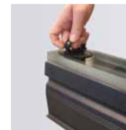
Ventouse «Grappin» pour retirer le luminaire de son boîtier d'encastrement.

Option(s) : Boîtier de raccordement étanche IP68 code : 012-9052.