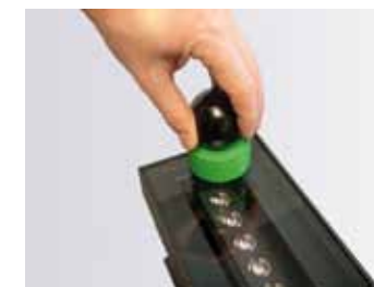
Orientation sans ouverture du produit +/- 15°.